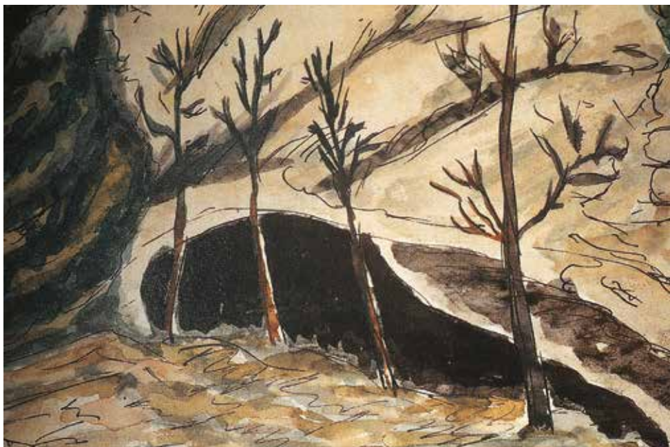
Sopra: antica stampa che riproduce l'ingresso della Grotta del Pettiroso. (dis. Karl Moser) Sotto: l'ingresso della Grotta del Pettiroso in una recente fotografia.